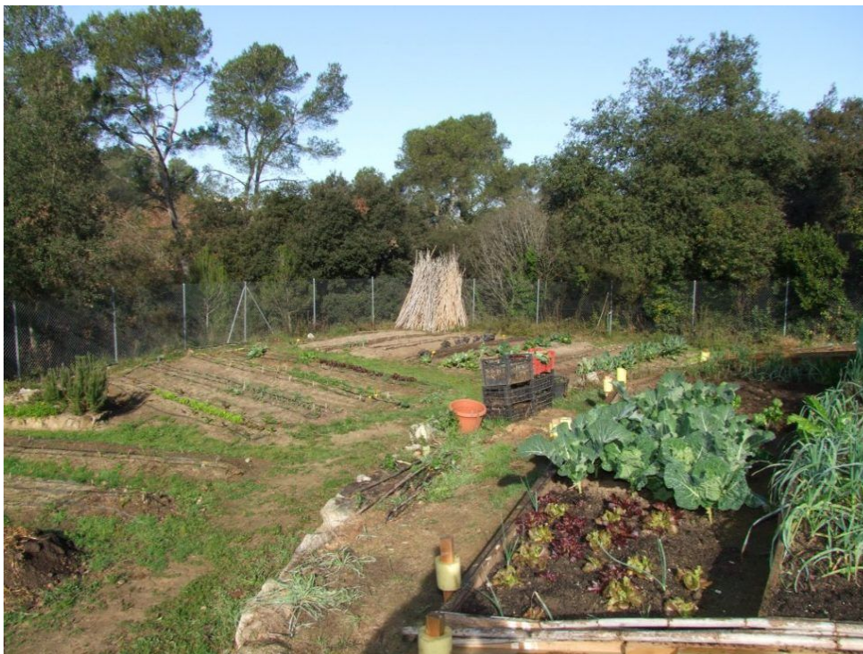
Hort de Can Pujades

Ara estem recuperant el seu hort i la seva memòria històrica!