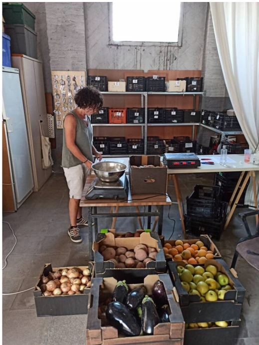
Repartiment de cistelles a El Mercat Cultural